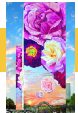
La Fresque des Roses