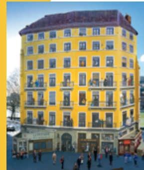
La Fresque des Lyonnais

Véritable vitrine de l'industrie, cette fresque reflétera son évolution à travers les époques et permettra de reconnecter l'industrie avec le grand public.