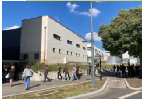
10 Bd Edmond Michelet, Lyon 8e

Pour moderniser l'image de l'industrie et renforcer l'attractivité des métiers industriels