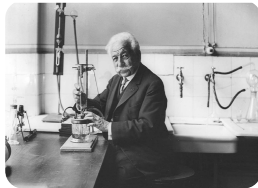
Auguste Lumière, inventeur du cinématographe mais aussi engagé dans la recherche médicale

Ce partenariat est même allé plus loin, en 2017, en détournant l'appareil Focal One® de son indication première, le traitement du cancer de la prostate pour soigner l'endométriose. C'est Gil Dubernard, gynécologue au service de gynécologie-obstétrique de l'hôpital de la Croix Rousse, qui a eu l'idée, de détourner le dispositif pour révolutionner le traitement de l'endométriose, une maladie qui touche deux Françaises sur dix en âge d'avoir des enfants.