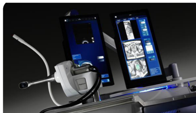
Le dispositif FocalOne